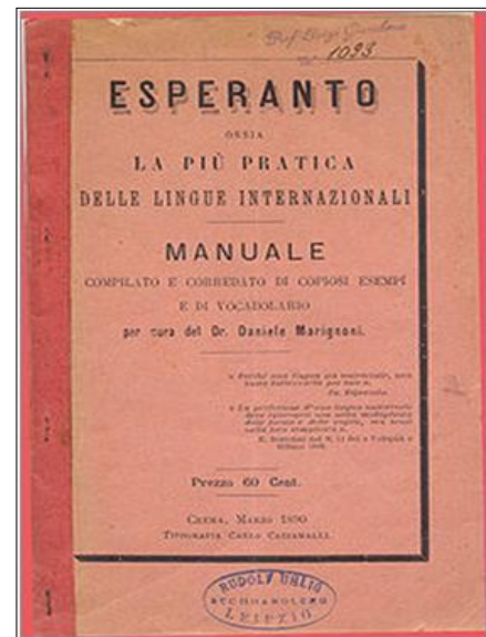
Lernolibro de Esperanto